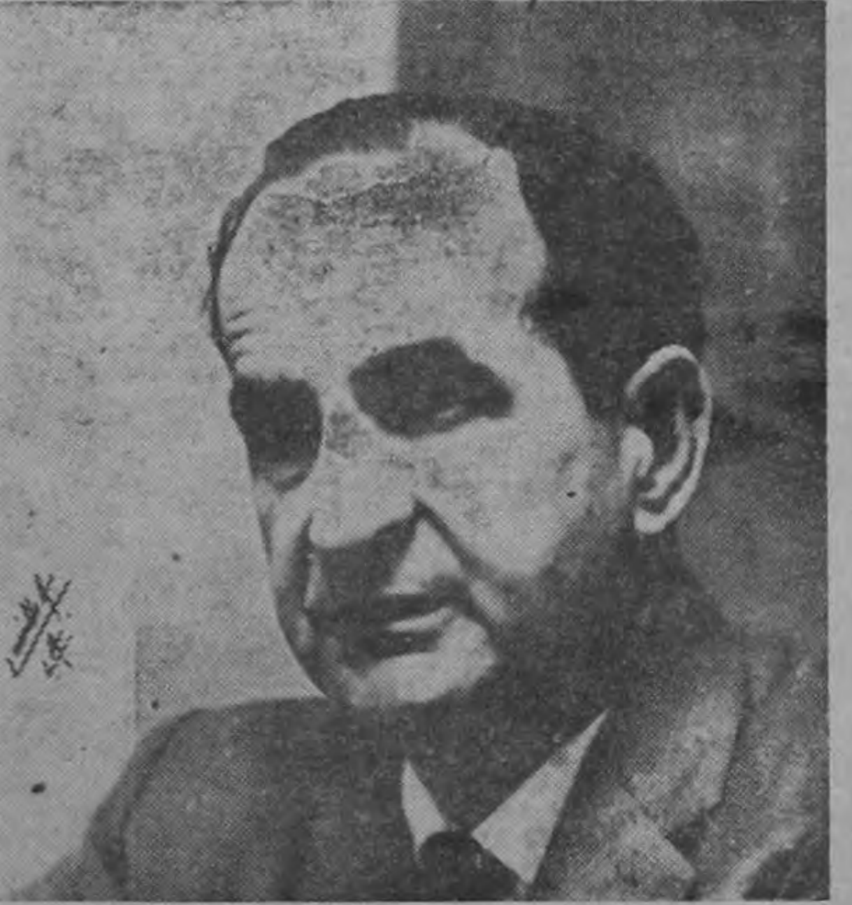
los más cercanos colaboradores del Sr. Figueres. A la derecha, el ex-Presidente en uno de los pasajes de su exposición.