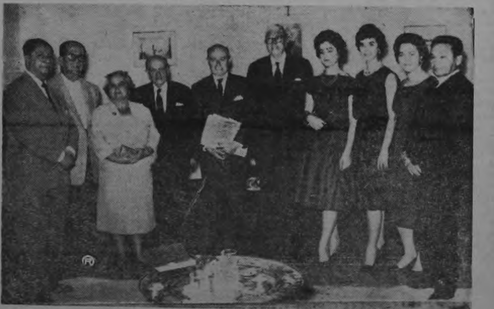
En la gráfica, aparecen los nuevos directivos del Instituto Sanmartiniano, filial de Costa Rica, cuyos nombres aparecen en el texto de esta información. (Foto VASQUEZ).